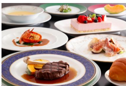
<伊丹シティホテル(株)> スカイレストラン ミナレット お食事招待券