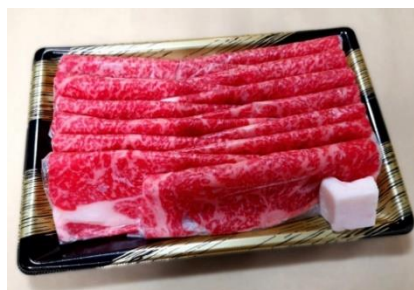
<牛匠上田> 但馬牛 ロースうす切り 500g