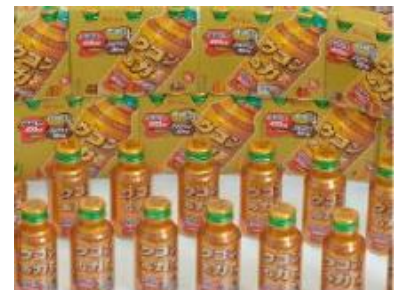
<ハウスウェルネスフーズ(株)> ウコンの力 ウコンエキスドリンク