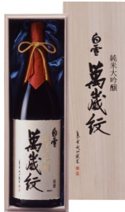
<小西酒造(株)> 超特撰 白雪 純米大吟醸 萬歳紋(原酒)

※伊丹市在住の方は、ふるさと寄附で税額控除を受けられますが、返礼品はございません