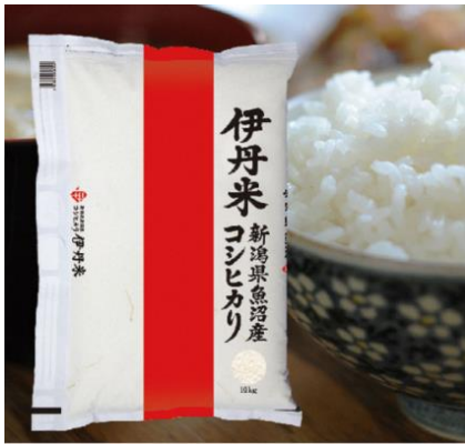
<伊丹産業(株)> 伊丹米