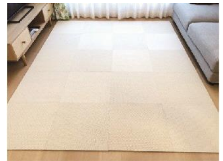
<東リ(株)> 吸着分割カーペット5㎡

※伊丹市在住の方は、ふるさと寄附で税額控除を受けられますが、返礼品はございません